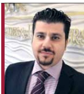
Насос Кириакидис Адвокат

Теперь, что касается сроков подготовки и легализации генеральной доверенности, то всю процедуру можно будет завершить в течение одного дня при условии, что Вы воспользуетесь услугами местных юристов.